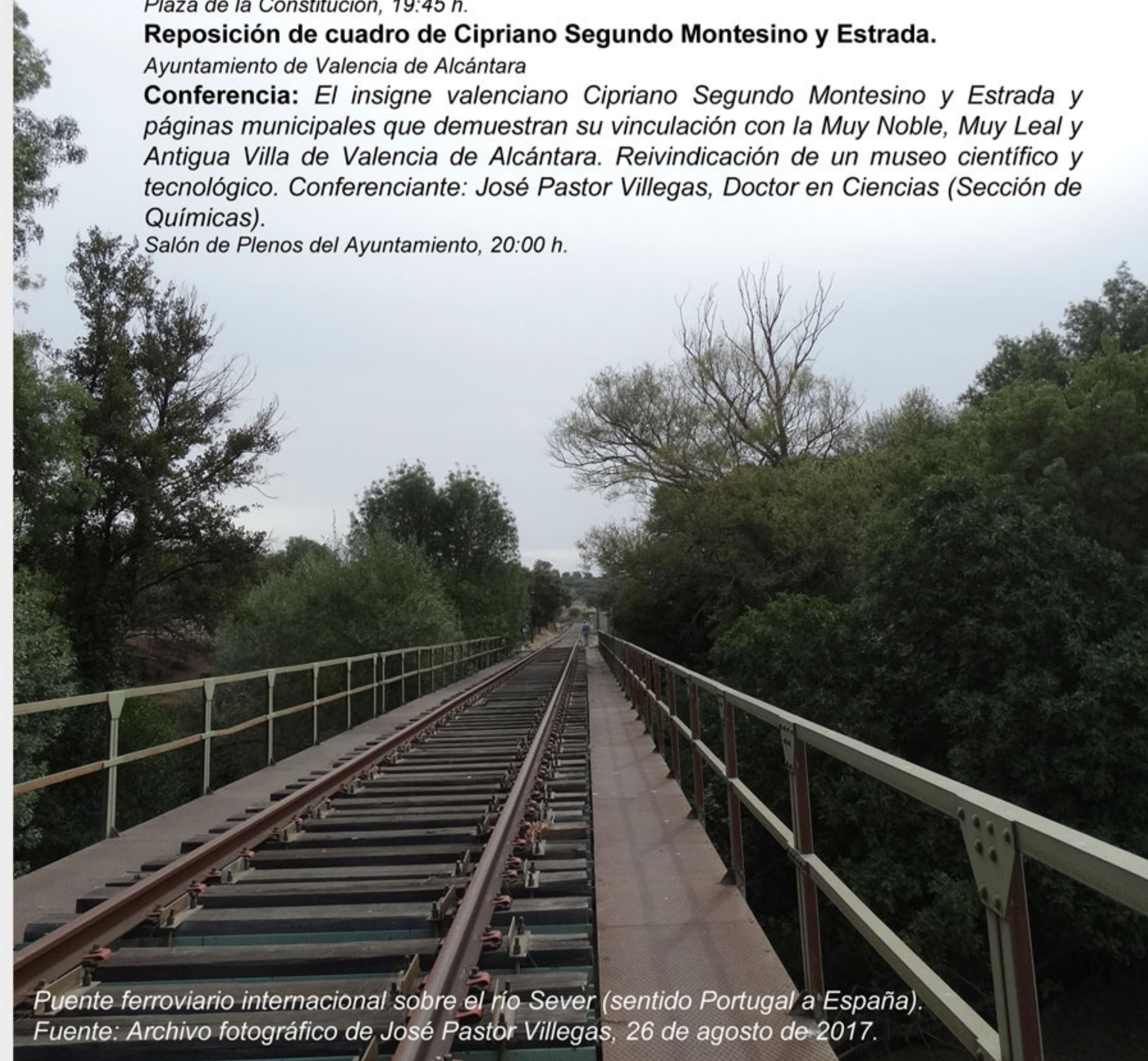
Puente ferroviario internacional sobre el río Sever (sentido Portugal a España).

Salón de Plenos del Ayuntamiento, 20:00 h.